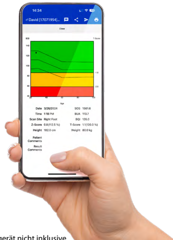
Endgerät nicht inklusive

Unkompliziert und bequem: Mit der App übersichtlich die Messergebnisse prüfen und direkt mit dem Patienten analysieren.